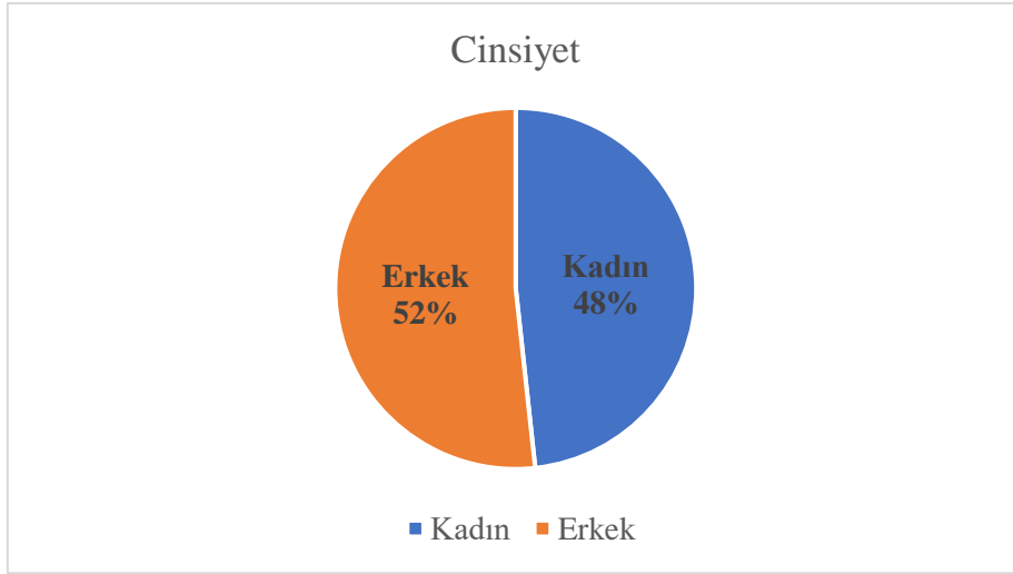
Grafik 1: Ankete Katılan Akademik Personelin Cinsiyet Dağılımı

Ankete katılım sağlayan akademik personelin %48'i kadın, %52'si erkektir.